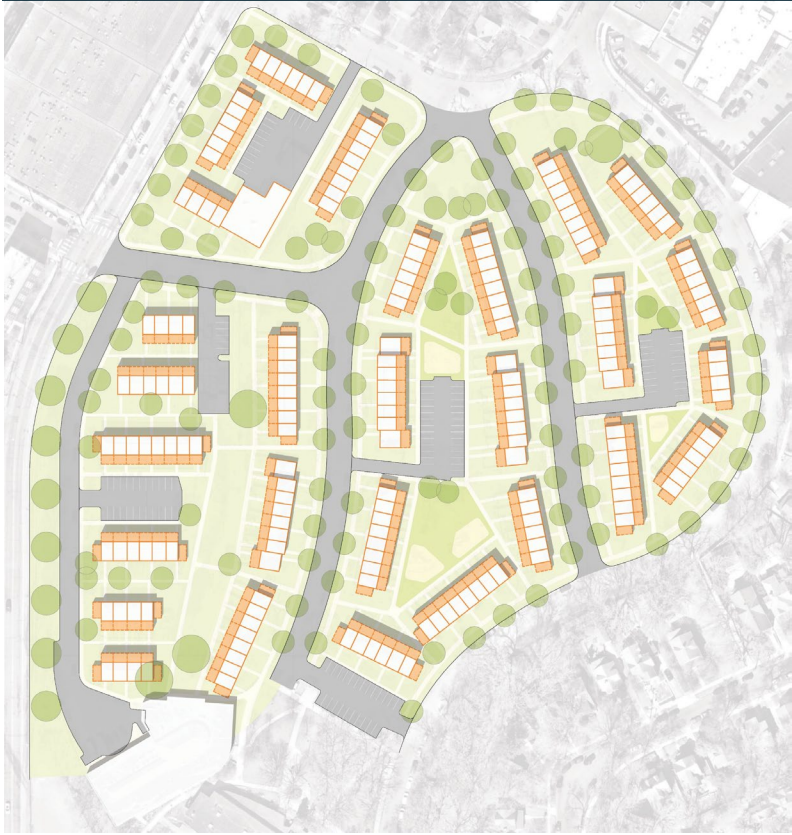
Ikhtiyaarka 1: Dayactir + Ballaarin