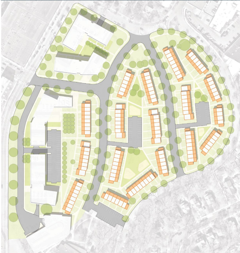
Ikhtiyaarka 2: Dayactir + Ballaarin + Dhismo Cusub